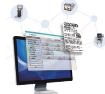
計量器マスタ 管理システム Fresh Action X