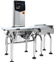
ウエイトチェッカー DACSシリーズ