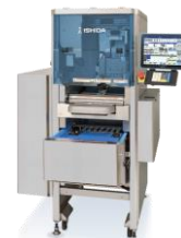
自動計量包装値付機 WM-AI LX