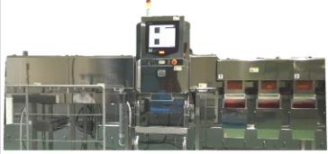
冷凍ほたて用異物検出 ランク選別システム IX-GN-4043