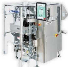
縦型ピロー包装機 INSPIRA