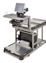
物流システム さいまるカート