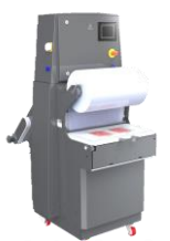
セミオート トレーシーラー QX-300FLEX