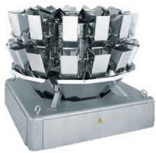
組合わせ計量機 CCWシリーズ